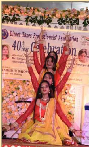
Another group dance.