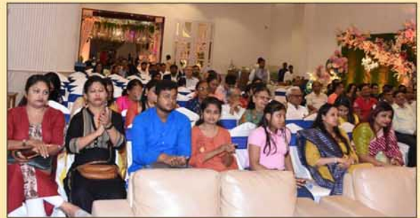
Audience enjoying the programme.