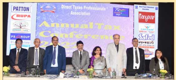
Group Pic of Inaugural Session of Annual Tax Conference 2022