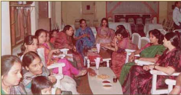
DTPA Ladies in Deepawali get together