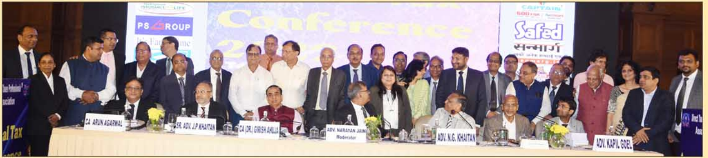
Group Pic. of Valedictory Session