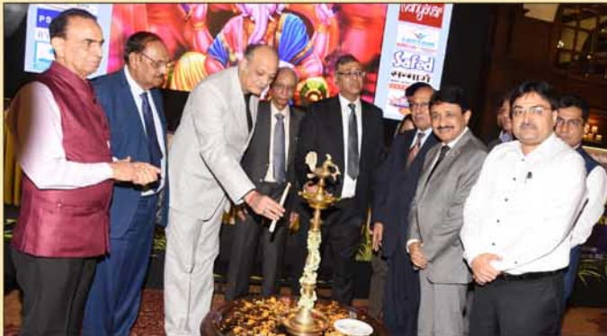
Hon'ble Justice Harish Tandon inaugurates DTPA Annual Tax Conference 2022