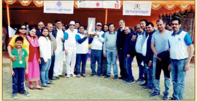
A group pic of Cricket Match of DTPA with IRS Association held in Jan. 2018.